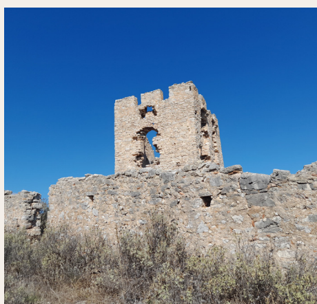
2. Άποψη του Πύργου της Βασιλοπούλας και του περιβόλου του από νότια. View of the tower and its precinct from the south.