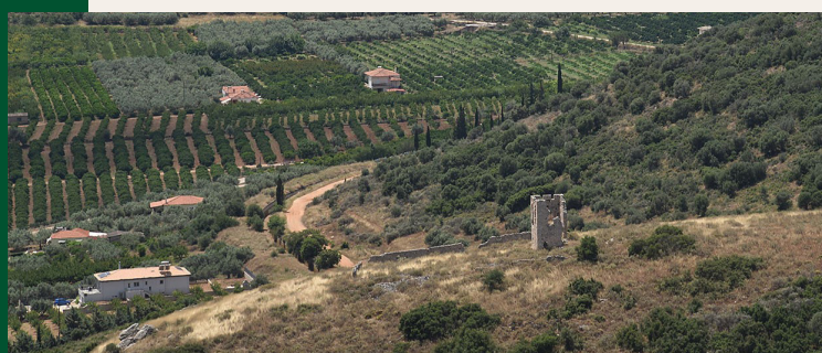
1. Άποψη του Πύργου της Βασιλοπούλας και της γύρω περιοχής από βόρεια. View of the tower and its surroundings from the north.