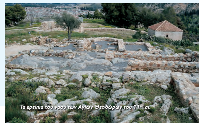
Τα ερείπια του ναού των Αγίων Θεοδώρων του 11 ου αι.

Με τις εργασίες που πραγματοποιήθηκαν αποκαταστάθηκε σε σημαντικό βαθμό η εξαιρετικά υποβαθμισμένη περιοχή της Ακροναυπλίας, αναδείχθηκε ένας αρχαιολογικός χώρος, με ελεύθερη πρόσβαση στο κοινό και απολύτως ενταγμένος στους κοινόχρηστους χώρους (δρόμοι, πλατώματα κλπ) της χερσονήσου.