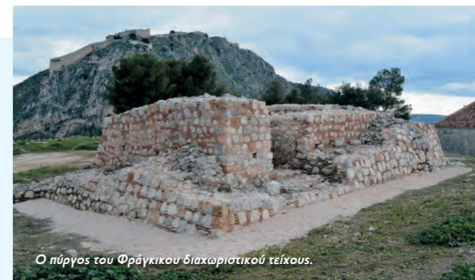
Ο πύργος του Φράγκικου διαχωριστικού τείχους.