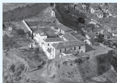
Η περιοχή του νοσοκομείου Καποδίστρια στις αρχές του 20 ου αι.

Το Ναύπλιο αποτέλεσε έδρα του Τούρκου διοικητή της Πελοποννήσου. Ο Τούρκος περιηγητής Εβλιγιά Τσελεμπί, που επισκέφθηκε την πόλη το 1668, αναφέρει ότι στο Κάστρο της Ακροναυπλίας υπήρχαν πολλά σπίτια και ένα μεγάλο τζαμί, το Φετιχιέ, το οποίο ήταν αρχικά χριστιανικός ναός αφιερωμένος στον Άγιο Ανδρέα, στην κορυφή του λόφου.