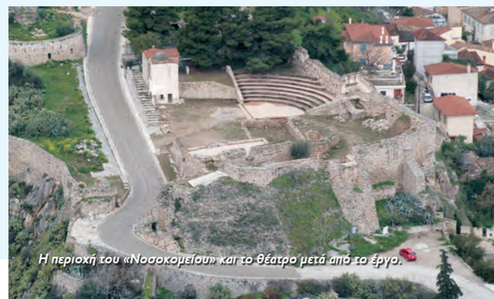
Η περιοχή του «Νοσοκομείου» και το θέατρο μετά από το έργο.

Το Ναύπλιο, ως Napoli di Romania , γίνεται πρωτεύουσα του βασιλείου του Μορέως (Regno di Morea) και οι Βενετοί προχωρούν με εντατικούς ρυθμούς στην οχύρωση του βράχου του Παλαμπίδιου. Η οχύρωσή του είχε ως αποτέλεσμα να υποβαθμιστεί το Κάστρο της Ακροναυπλίας, το οποίο με διάταγμα των Βενετών, από το 1686 προορίζεται μόνο για στρατιωτική χρήση. Το ανατολικό τμήμα του Κάστρου της Ακροναυπλίας και η Πύλη της Ξηράς της Κάτω πόλης ενισχύθηκαν με τη δημιουργία του νέου προμαχώνα Grimani (1706).